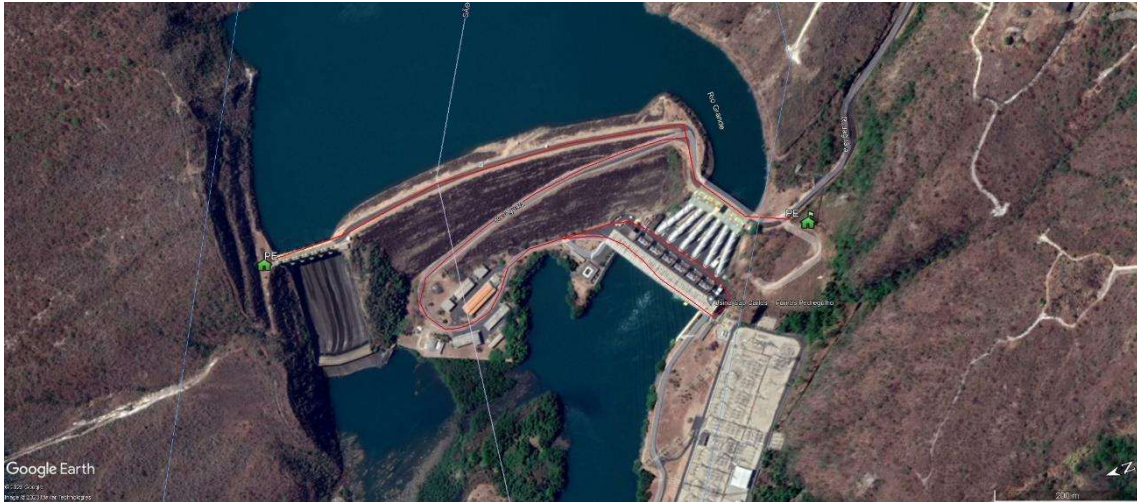
Figura 1 – PEs e RF da UHE Luiz Carlos Barreto de Carvalho.

A Figura 1, a seguir, apresenta os pontos de encontro e rotas de fuga deste empreendimento, que se encontram também em KMZ.